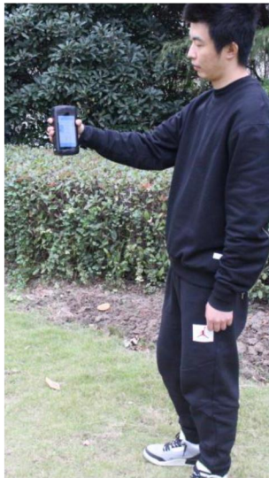
图 1. 产品使用示意

蓝菲光学 LFRT-H100 手持光谱反射率测试仪基于安卓平台集成了可见到近红外 CCD 光谱仪，获取反射光谱并计算反射率。便携式的设计便于应用于多种场景，特别是户外使用。测试数据可以保存或上传，便于离线分析。