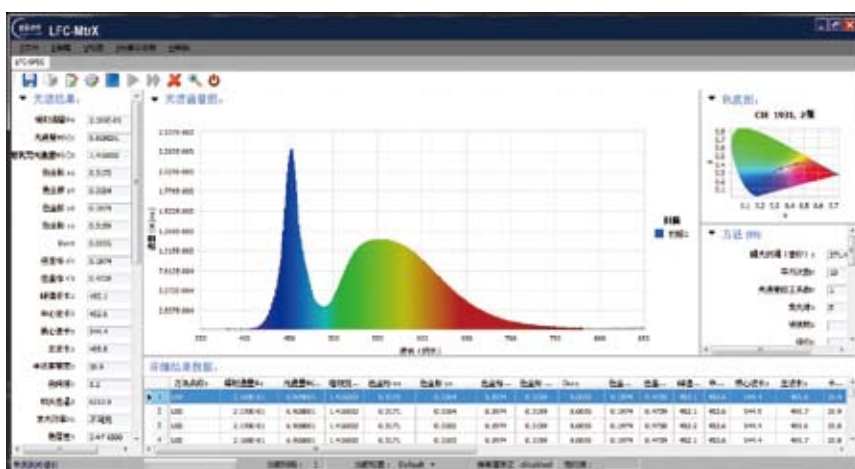
光测量软件 LFC-SPEC (中/英文)